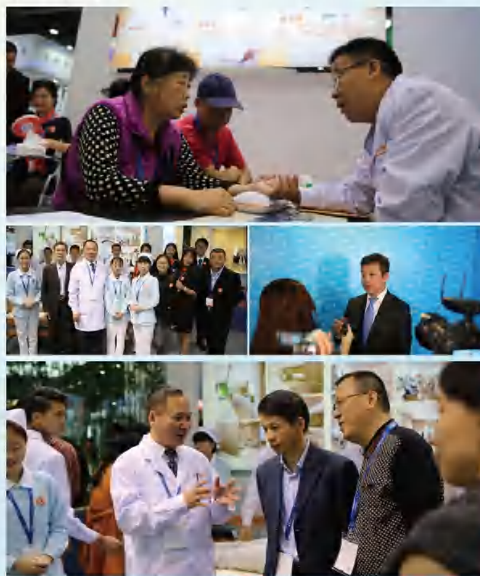
郑院长回答咨询问题

当天,由广东祥利集团倾力打造的百悦百泰城市颐养中心(简称“百悦百泰”)随着老博会的开幕,也闪亮登场,开始进入了中国养老产业同仁的视野。百悦百泰以成为中国五星级颐养服务的倡导者为目标,以优越的地理、硬件、软件综合实力和服务形象,成为本届老博会上令人瞩目的场景。每天到百悦百泰展台进行健康评估、检测和咨询的人士络绎不绝,场面非常火爆。